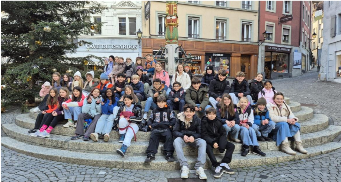
Die 5./6. Klässler aus Holziken trafen die welsche Partnerklasse in der Altstadt von Lausanne.