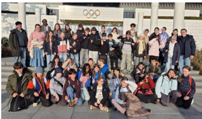
Vor dem Eingang zum olympischen Museum in Lausanne-Ouchy.