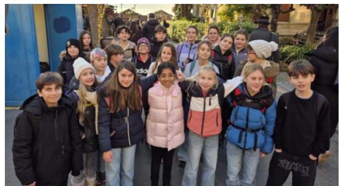
Am Weihnachtsmarkt in Montreux.